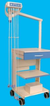
Gerätewagen PPC-1220 mit UNISOG Elektroden-Sauganlage und Schublade