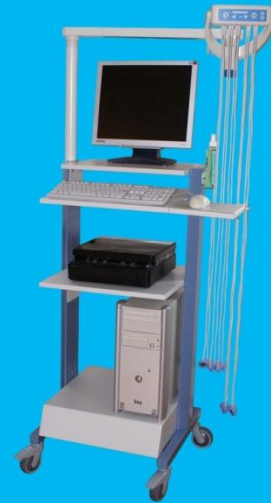
Gerätewagen PPC-1330 mit UNISOG Elektroden-Sauganlage, PC, Drucker und Monitor