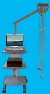
UNISOG Elektroden-Sauganlage Montagemodell an FUEGO Gerätewagen

Unsere Gerätewägen eignen sich im medizinischen Bereich für die mobile und flexible Unterbringung von kleineren Gerätekombinationen. Diese Gerätewägen bieten flexible Ausbau- und Variationsmöglichkeiten (Anzahl der Ablageplatten, Schubladen).