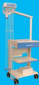
UNISOG Elektroden-Sauganlage Montagemodell an Gerätewagen PPC-1220