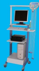
UNISOG Elektroden-Sauganlage Montagemodell an Gerätewagen PPC-1330