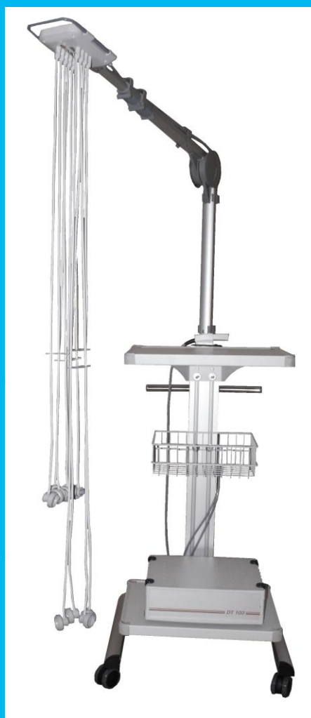
Wagen MW-1000-44 mit Elektroden-Sauganlage