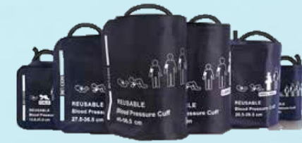
Blutdruckmanschetten Passend für den MS 1100 Vitalparameter-Monitor.