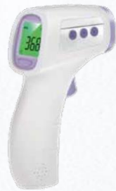
Modul zur Temperaturmessung mit Infrarotthermometer. Anzeige erfolgt über MS 1000 oder MS 1100 Vitalparameter-Monitor. (bitte bei Gerätebestellung mit angeben, da das Modul nicht nachrüstbar ist)