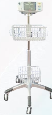
Fahrstativ MW-1100-70 mit 5 Rollen, 2 Zubehörkörben und Adapterplatte. Passend für die Monitorserie MS 1000.