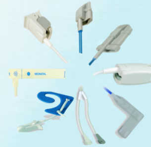
Umfassendes Portfolio an SpO2 Sensoren. Passend für die Monitorserie MS 1000.