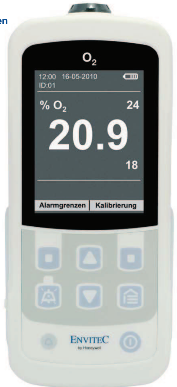
Gerät in Originalgröße